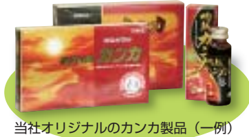
当社オリジナルのカンカ製品（一例）

当社はカンカのバイオニアとして、自社製品の販売や OEM 供給を行っています。栽培から抽出まで一貫体制を実現しており、全てのラインを自社で管理することが可能なため、常に安定した高い品質で供給することができます。