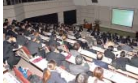
国際カンカシンポジウム International Symposium on Kanka