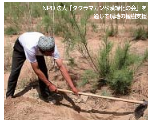
NPO 法人「タクラマカン砂漠緑化の会」を通じて現地の植樹支援

タクラマカン砂漠でのカンカ栽培により現地での経済効果が高まり、同時に植樹による砂漠緑化にも大きく貢献することから、当社では NPO 法人「タクラマカン砂漠緑化の会」を通じ、現地の植樹支援を積極的に行っています。